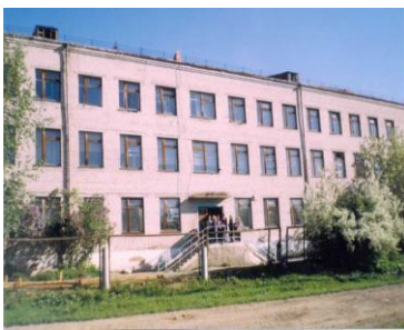
ГОУ СО «Березовская СКШИ»