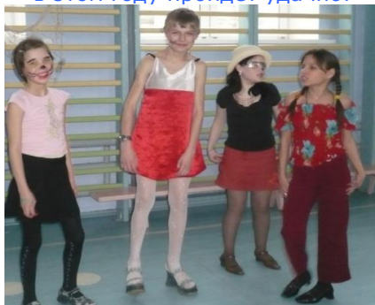
«Первое апреля» два года назад...

Первое апреля в нашей школе всегда отмечалось с успехом! Пусть и в этом году пройдет удачно!