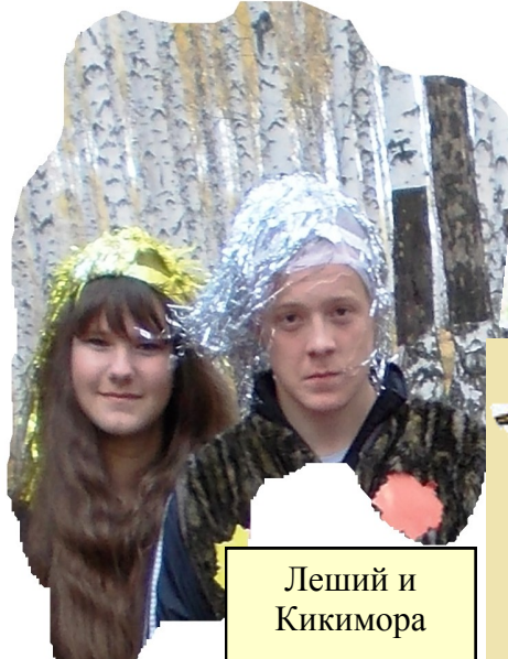
Леший и Кикимора

Закончилась быстро забава - игра, И наступает прощанья пора. Лес нам осенней листвою помахал, В гости к себе он вновь приглашал.